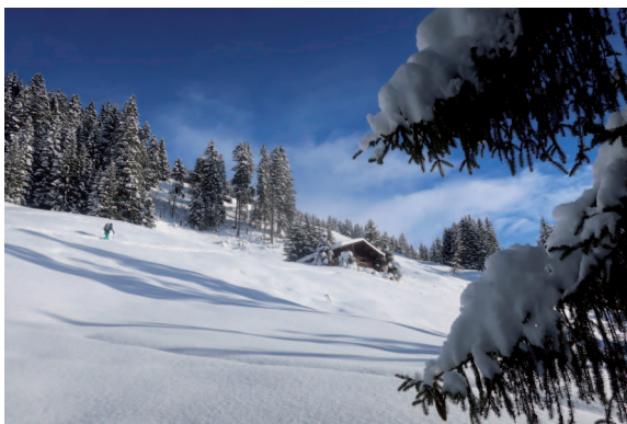
Märchenwald, Winterzauber und Abfahrtsgenuss.