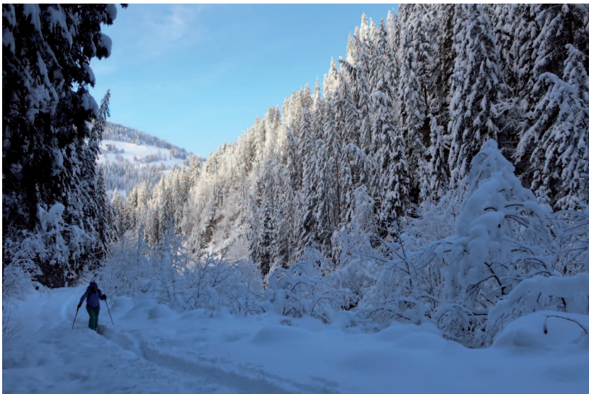
Aufstiegsvariante durch das Färmelbachtobel.